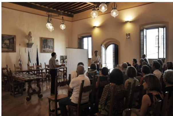
Sala Consiliare del Comune di Anghiari – Premiazione 2018