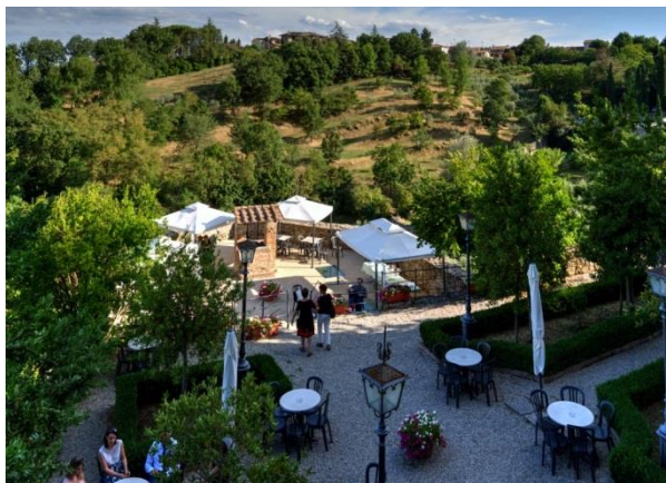
“Giardini del Vicario”

A seguire rinfresco presso il Caffè-Win Bar “ Giardini del Vicario ” in P.zza del Popolo, 7 ad Anghiari.