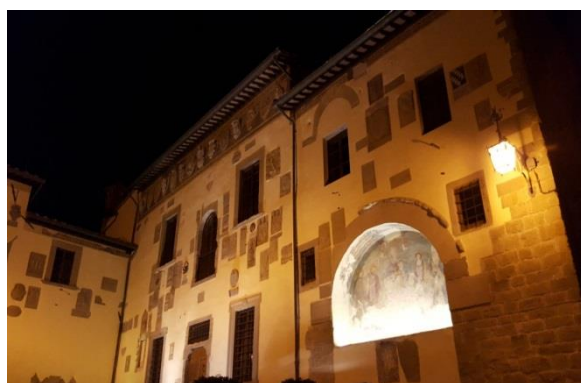
Palazzo del Comune