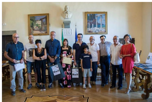
Premiati - Sala Consiliare del Comune di Anghiari – Premiazione 2018