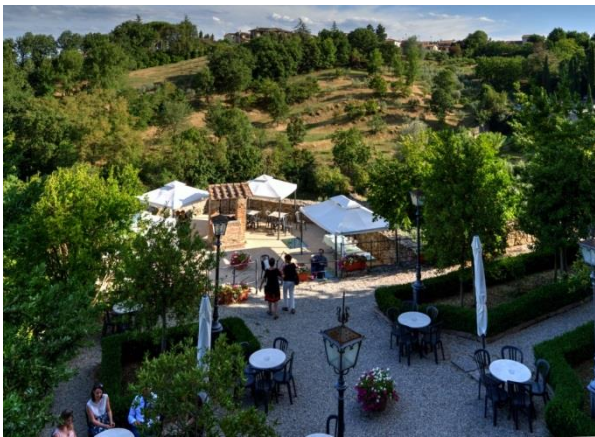
“Giardini del Vicario”