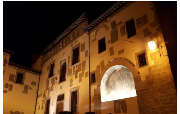
Palazzo del Comune