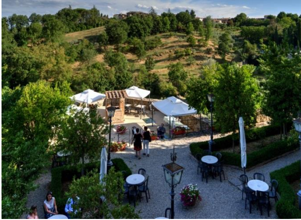
“Giardini del Vicario”