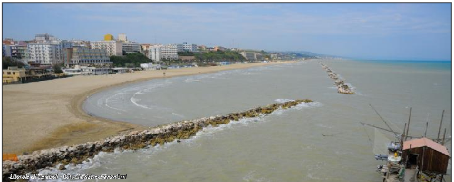
Lido di Termoli