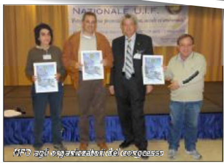
M.F.O. agli organizzatori del congresso

Le foto della premiazione dei vincitori del 7° Concorso Digitale UIF Internet 2009 sono a pag. 13.