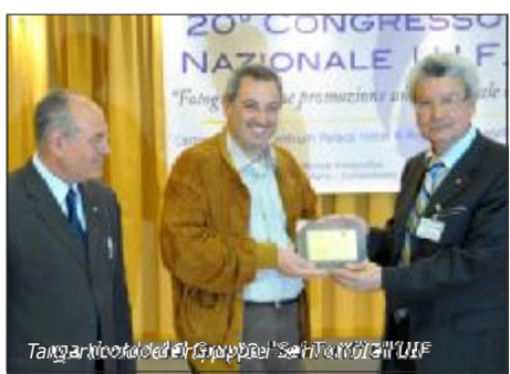
Targa ricordo del Gruppo di San Tommaso UIF