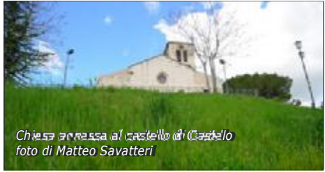
Chiesa annessa al castello di Castello