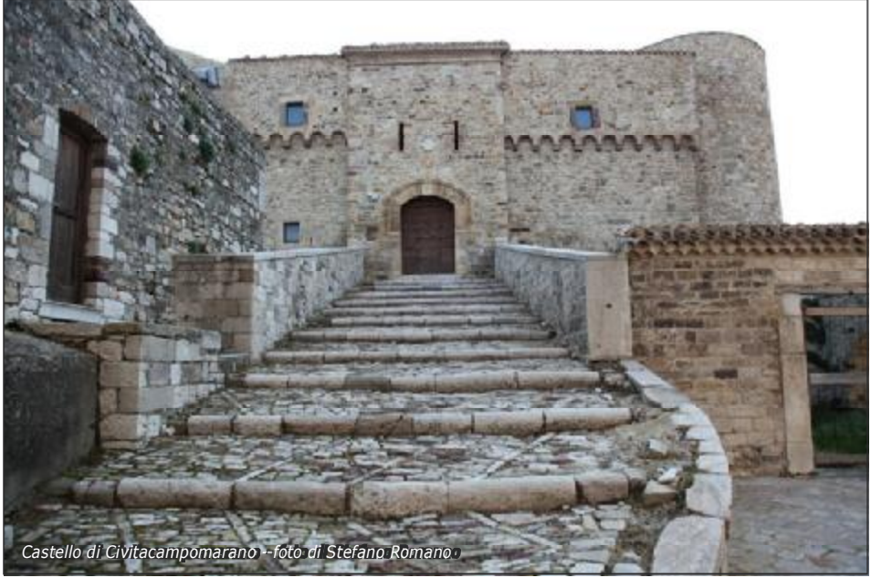
Castello di Civitacampomariano