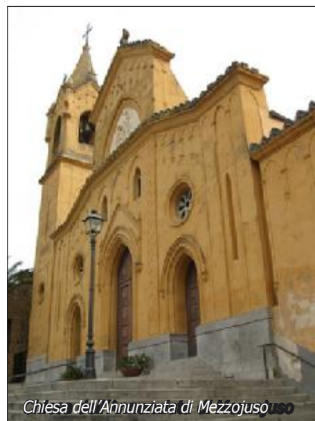
Chiesa dell'Annunziata di Mezzojuso

Al di là delle origini di Cefalà Diana (posto a m.560), la fondazione dello stesso risale alla seconda metà del se-