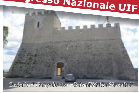
Castello di Campobasso