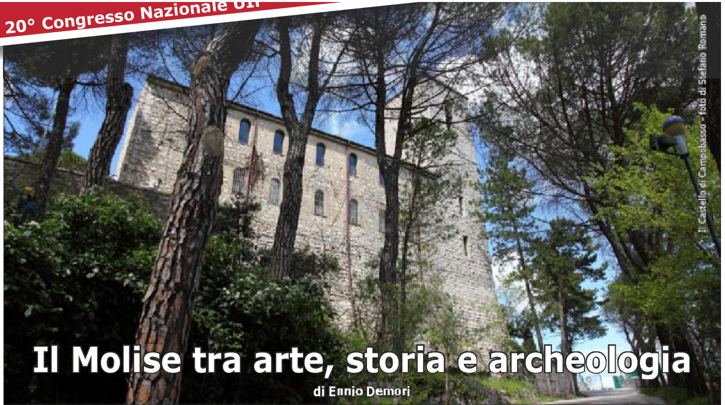
Il Castello di Campobasso