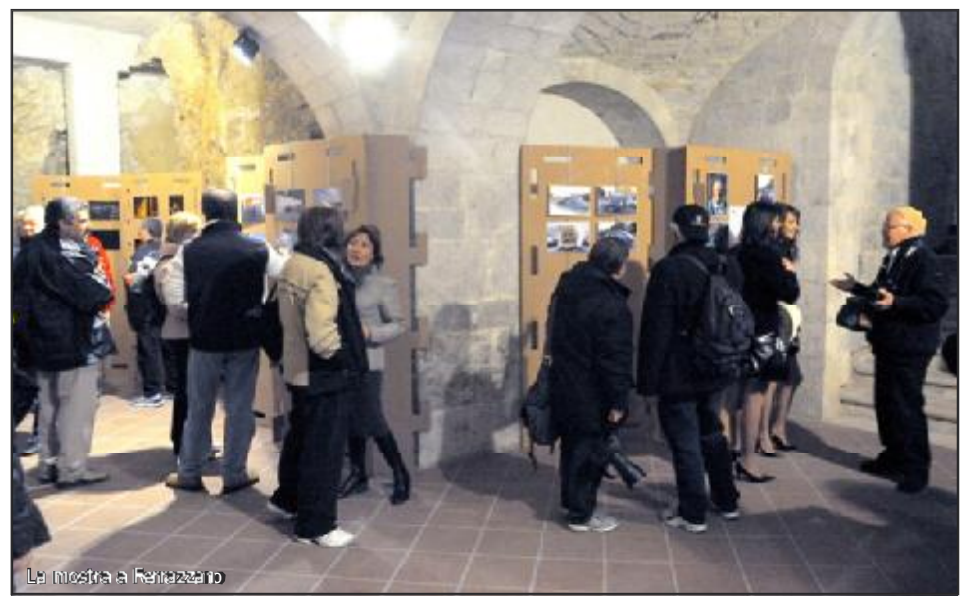
La mostra a Ferrazzano