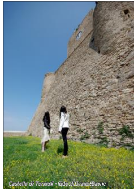
Castello di Termoli

domina, con la sua struttura, su una lunga e bella spiaggia antistante il mare Adriatico), il Castello Monforte sul monte S. Antonio (m. 792 s.l.m.) dalla cui Torre si può dominare la città di Campobasso; per le Chiese, delle quali alcune hanno potuto essere ammirate e fotografate, come S. Bartolomeo, S. Giorgio, S. Leonardo, S. Antonio Abate a Campobasso e il Duomo a Termoli. In particolare, su Campobasso si può sottolineare che, a prescindere di essere il capoluogo della Regione, è apparsa come una città molto movimentata nelle sue strade e piazze; oltre a ciò è caratterizzata da un centro storico molto bello (a forma di ferro di cavallo intorno al Monte S. Antonio) in cui le stradine (tipiche della struttura medioevale), intervallate da lunghe e comode scalinate, si inerpicano verso il Castello Monforte, lasciando girovagare lo sguardo del turista sulle "bellezze che si incontrano", quali vedute panoramiche e scordi architettonici sulle chiese già citate, sulle porte antiche e i piccoli angoli veramen-