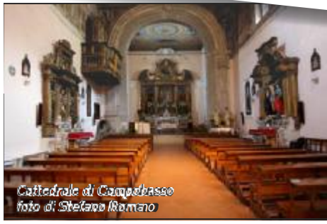
Cattedrale di Campobasso