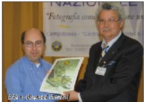
BFA a Giovanni Firmani