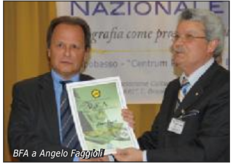
BFA a Angelo Faggioli