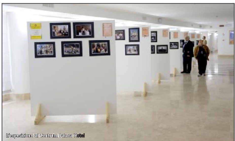
L'esposizione al Centrum Palace Hotel