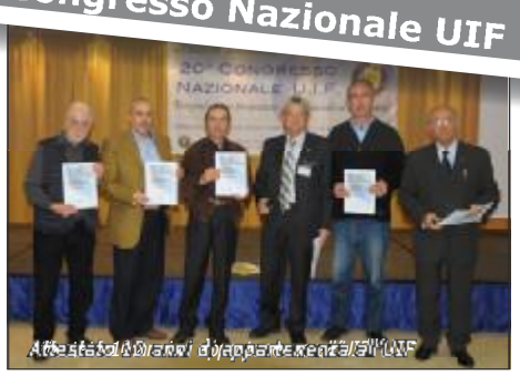
Attestato di 10 anni di appartenenza all'UIF