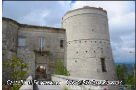
Castello di Ferrazzano