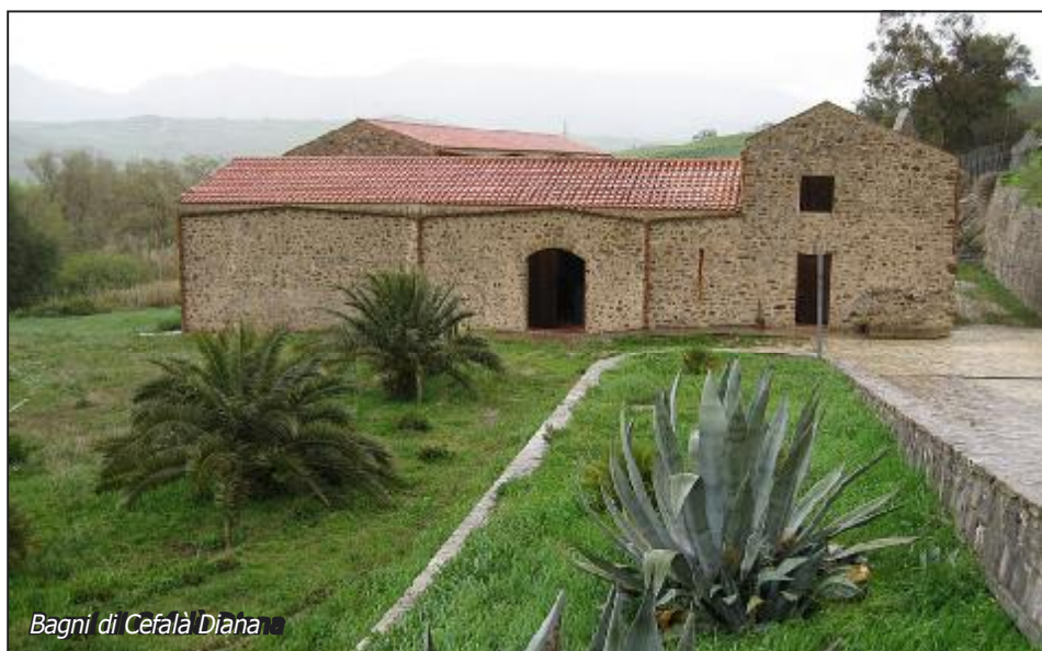
Bagni di Cefalà Diana

colo XVIII. Vicino al paese si trova il Castello, probabilmente costruito fra la fine del XIII e la prima metà del XIV secolo. La visita del gruppo si è comunque incentrata sui "Bagni di Cefalà" consistenti in un edificio rettangolare (restaurato di recente sia in esterni che in interni) la cui costruzione viene attribuita al periodo arabo; si tratta di un impianto termale che sfruttava una sorgente di acque calde attiva fino ad alcuni lustri fa e rappresenta l'unico monumento simile in Sicilia.