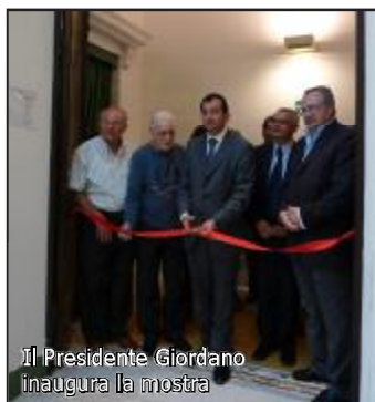
Il Presidente Giordano inaugura la mostra

fotografatore di Enzo Barone. I primi scatti nel 1993 durante un viaggio negli Stati Uniti e più precisamente nell'Arizona, poi nel 2000 in Egitto, nel 2002 in India e l'anno dopo in Perù, nel 2004 in Cina e l'anno successivo in Giamaica ed in Messico. Il viaggio è proseguito nel 2006 in Cambogia, nel 2008 in Australia, Vietnam e Polinesia per concludersi nel 2009 a Bangkok e nelle Isole Fiji. "Tutte le immagini esposte - ha scritto il Presidente UIF Nino Bellia nel depliant di presentazione - nella mostra evidenziano come l'autore, durante questo suo viaggiare per il mondo, sia stato un pò più curioso di un qualsiasi viaggiatore. Un vero fotografo che sa osservare, raccogliere e trasmettere tutto il fascino di questi luoghi apparentemente lontani". "La sensibilità, l'inventiva, la tecnica dimostrata in queste immagini - ha sottolineato il direttore artistico dell'UIF Antonio Mancuso - mi fa dire che il fotografo Enzo Barone ha compiuto quel passo importante in fotografia, ecco perché posso affermare che il fotografo è diventato artista. Le immagini di Enzo Barone, con questa mostra, diventano un qualcosa di più. Una moltitudine di