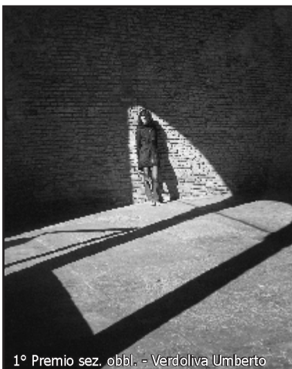
1° Premio sez. obbl. - Verdolina Umberto