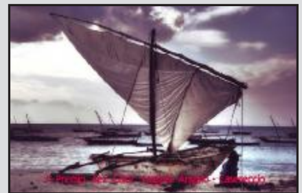
1° Premio sez. Color Taggla Anna - Palermo