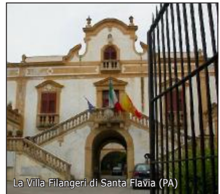
La Villa Filangieri di Santa Flavia (PA)

Il Congresso regionale siciliano e la manifestazione della 5 a giornata del fotoamatore si terranno a S. Flavia in provincia di Palermo nei giorni 24 e 25 Ottobre 2009, presso i locali della settecentesca villa Filangieri, sede del Comune. Nella giornata del 24 si terrà il congresso regionale con inizio dei lavori alle 9.30. Dopo la pausa pranzo trasferimento presso la "Villa Cattolica" di Bagheria dove ha sede il Museo di Renato Guttuso e quello della Fotografia. Nella villa, in esterni, si terrà un workshop fotografico con modelle diretto da Fabrizio Dia dell'agenzia Hostessmodelle di Palermo. Il giorno successivo, alle