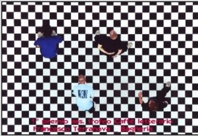
1° premio ass. trofeo Caffè letterario Francesco Terranova - Bagheria