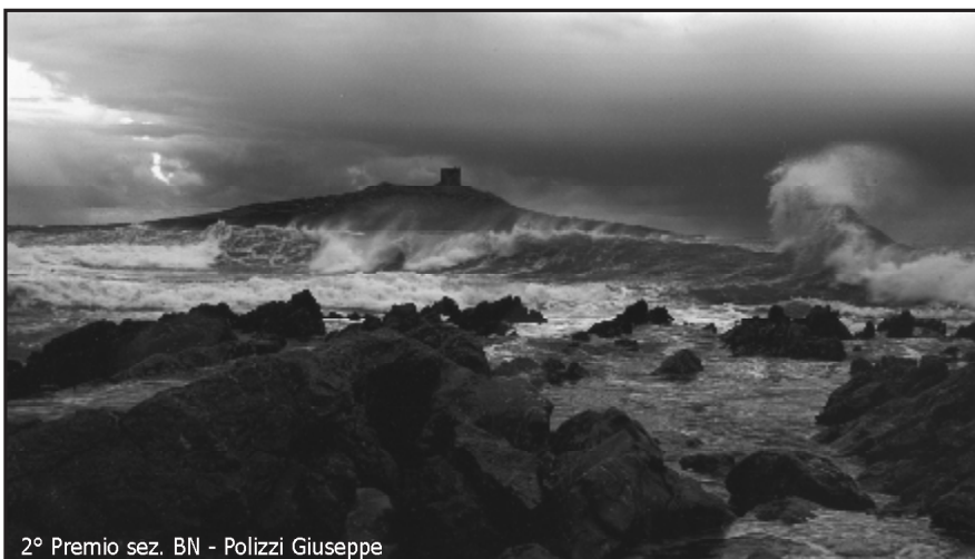
2° Premio sez. BN - Polizzi Giuseppe