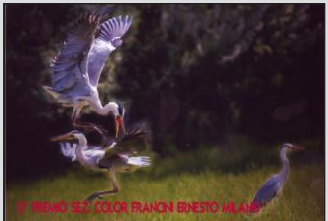
1° PREMIO SEZ. COLOR FRANCI ERNESTO MILANO