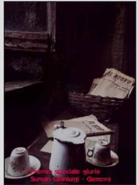
Premio speciale giuria Suman Gianluigi - Genova