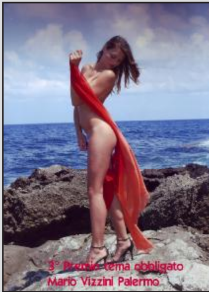
3° Premio tema obbligato Mario Vizzini Palermo